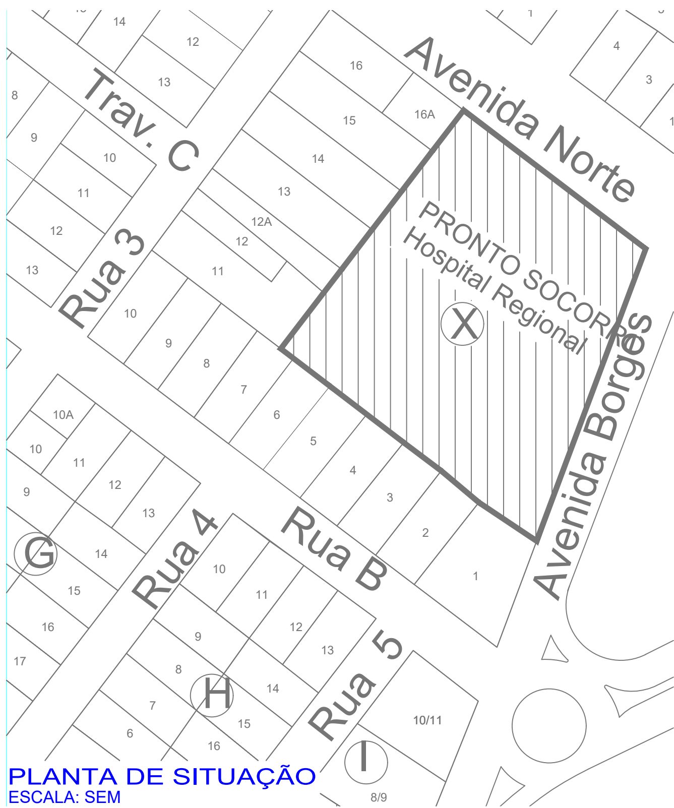
PLANTA DE SITUAÇÃO ESCALA: SEM

CB ACESSO DE VIATURA NA EDIFICAÇÃO E ÁREA DE RISCO